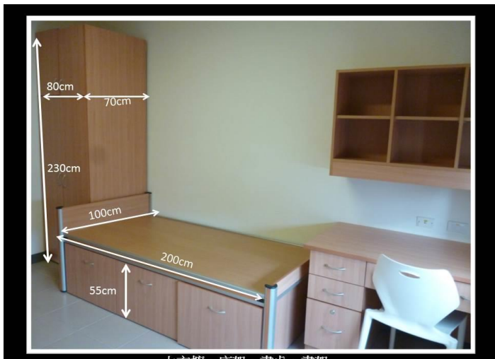
衣櫃、床架、書桌、書架